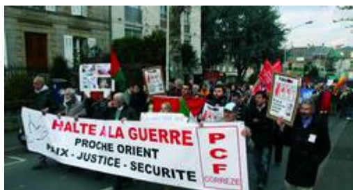
Manifestation en Corrèze pour la paix au Proche Orient